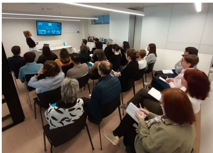
"Charla dirigida a las personas trabajadoras de Gestión del estrés"